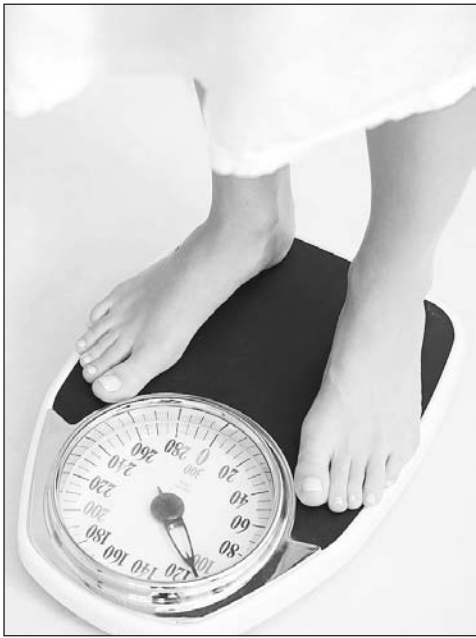
Une rencontre d'information portant sur la méthode Poids Plaisir aura lieu le 29 septembre prochain.

Quelques statistiques : des données publiées en 2005 par Statistiques Canada révèlent que le taux d'obésité chez les jeunes de 2 à 17 ans a presque triplé en 25 ans (de 3 à 8 %), et qu'il a presque doublé chez les adultes (de 14 à 23 %). Au Québec, des données provenant de l'Institut national de la santé publique démontrent que 39,1 % des femmes souffrent d'em-